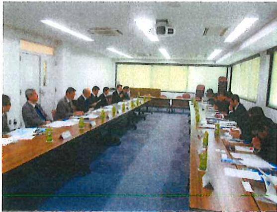
先生方との情報交換